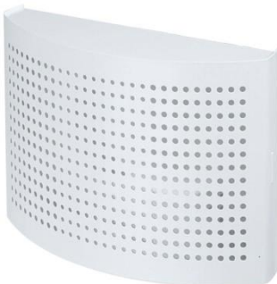
Kuva 5. tuloilman jakaja (sisälle tuleva osa)