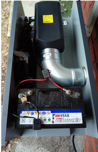
Kuva 5. lämmittimen sijoitus laatikkoon