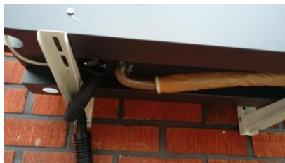
Kuva 6. pakoputki ja paloilmanotto