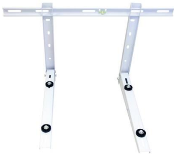
Kuva 2. asennuslaatikon kannakesarja

-Älypuhelinetäohjain GSM SIMCOM 2 (lisävaruste)