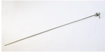
Kuva 7. tankkiotin