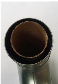
Kuva 3. seinäpäpivienti 100/75 TUPLA (säätävä pituus)